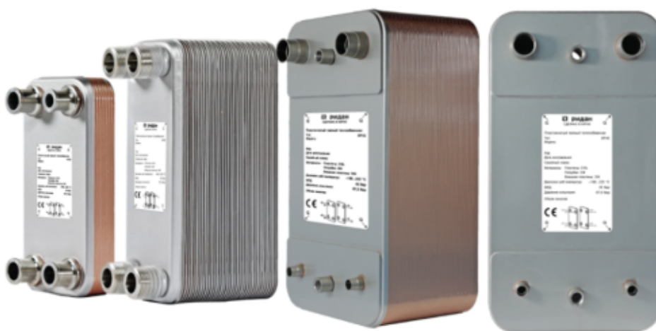
Рис.1 - Внешний вид теплообменников пластинчатых типа ВРНЕ

Теплообменники пластинчатые типа ВРНЕ предназначены для передачи тепловой энергии от одного теплоносителя к другому. Теплообменники пластинчатые типа ВРНЕ могут применяться в холодильных установках (компрессорных, абсорбционных), а также в тепловых насосах. В качестве рабочих сред могут использоваться с ГХФУ, ХФУ, ГФУ, ГФО и природные хладагенты не вступающие в реакцию с медью, технические и холодильные масла, вода для технических нужд и систем ГВС, спиртосодержащие растворы, водные растворы гликолей.